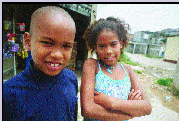
Jardim Ângela: campeão no ranking da exclusão