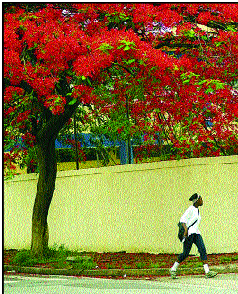
Moema: o melhor lugar para se viver em São Paulo

de família analfabetos superava a média dos municípios, em alguns casos em até 20,08%. A maior concentração estava no Grajaú, e a menor, na Barra Funda. O percentual de chefes de família com oito a 14 anos de estudo cresceu 32,20%, com destaque para Lajeado. Outra boa notícia é que o número dos que têm nível universitário cresceu 13,85% no conjunto da cidade, no mesmo período. A maior incidência de diplomas de 3º grau foi registrada no distrito do Iguatemi.