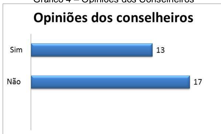
Gráfico 4 – Opiniões dos Conselheiros

O Gráfico 4 demonstra que 56,67% dos entrevistados afirmam que as opiniões dos conselheiros não são respeitadas porque os colaboradores dos serviços de saúde discordam da postura dos conselheiros. Alguns profissionais não conhecem o papel do conselheiro e outros não aceitam porque se sentem