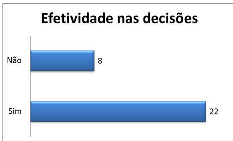
Gráfico 2- Efetividade

Já no Gráfico 2, observa-se que dos 30 conselheiros entrevistados 73,33% confirmaram que as deliberações são efetivadas porque são registradas em ATA. Sendo assim são acompanhadas no conselho gestor locais e em outras instâncias até a sua conclusão. Entretanto 26,67% mencionam que alguns assuntos discutidos mesmo registrados em ATA são esquecidos.