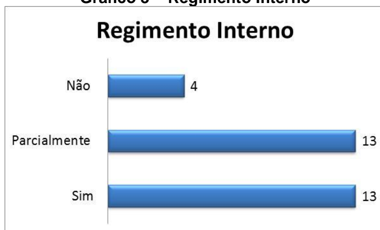
Gráfico 3 – Regimento Interno

No gráfico 3 – observa-se que o conselho busca realizar as discussões das políticas de Saúde dentro dos diferentes segmentos. O Regimento Interno do Conselho Gestor possibilita que as discussões sejam direcionadas. As atividades dos conselheiros são consideradas de relevância pública e devem ser pautas pela ética. A pesquisa aponta que 43,33% dos conselheiros entrevistados consideram que o Regimento Interno é respeitado totalmente, 43,33% consideram que é respeitado parcialmente e 13,34% afirmam que o documento não é respeitado.