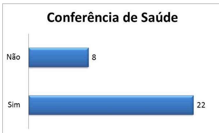
Gráfico 5 – Conferência de Saúde

Neste item da pesquisa procurou-se avaliar a participação dos conselheiros nas Conferências de Saúde e temas discutidos. 73,33% dos entrevistados afirmam que já participaram de uma ou mais conferência de saúde. Os citados pelos entrevistados foram as duas últimas conferências, ano de 2010 - Tema - 100% SUS e 2011 Todos Usam o SUS. 26,27% nunca participaram de nenhuma conferência de saúde. É importante ressaltar que a representatividades dos usuários não podem ser escolhidos pelos governantes.