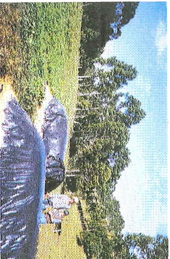
Silagem de milho armazenada em silo de superfície. Ao lado, área com trevo branco - inverno/99