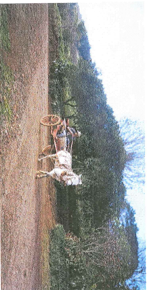
Inseminador da Comunidade São Bráz atendendo a uma solicitação de serviço de inseminação.